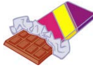
Une tablette de chocolat