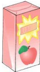
Du jus de fruits