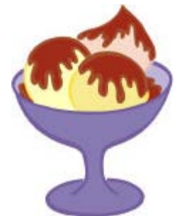
Une coupe de crème glacée