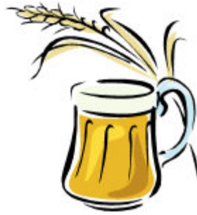
De la bière