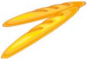
Des baguettes de pain