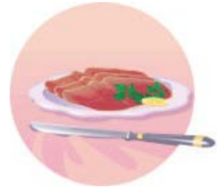
De la viande