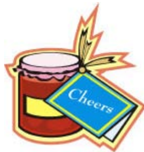
Un pot de confiture